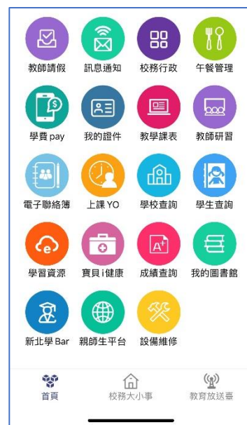
新北校園通 APP-功能模組示意圖

為使家長了解寒假前後，學校各項準備因應防疫工作，茲將各處室提醒內容，臚列於下，敬請家長務必撥冗參閱。