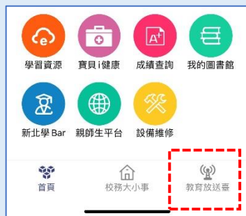
新北校園通 APP-「教育放送台」模組示意圖