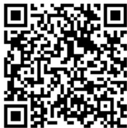
新北校園通家長操作說明