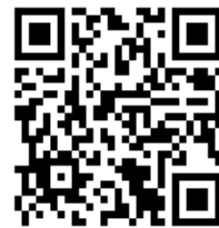
「安心服務表單」連結