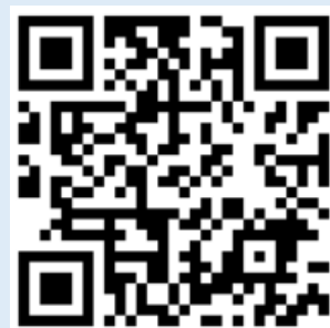
豐年國小學校網站